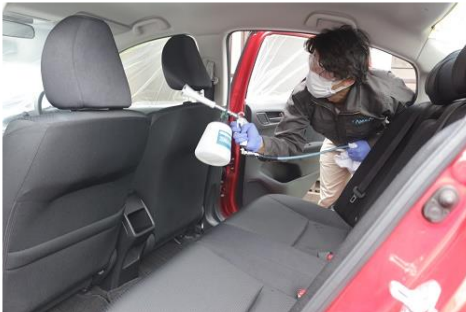
抗ウイルス抗菌コーティング(「レコナガード エアフレッシュ」) 教習車内の施工の様子