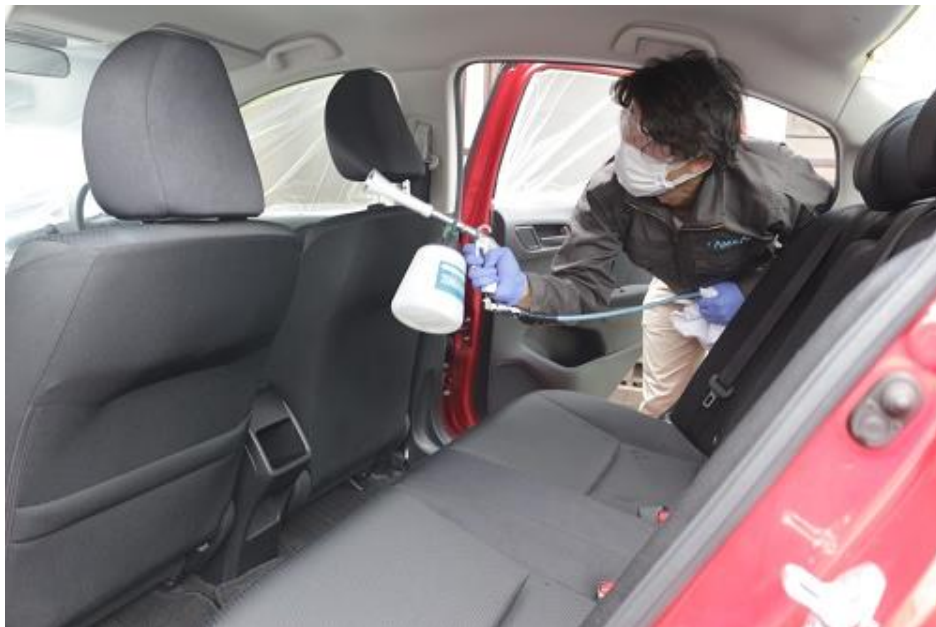
抗ウイルス抗菌コーティング(「レコナガード エアリフレッシュ」) 教習車内の施工の様子